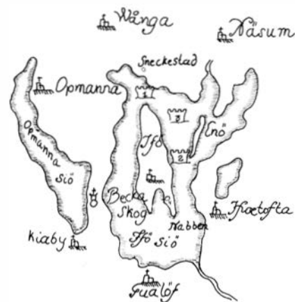
Fig. 2. 1-3 i texten nämnda platser för Brattingsborg. 4:an anger platsen för Håfgården.

1) Dess fundament ligger Nordost imellan