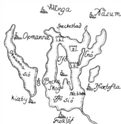
Fig. 2. 1-3 i texten nämnda platser för Brattingsborg. 4:an anger platsen för Håfgården.

1) Dess fundament ligger Nordost imellan