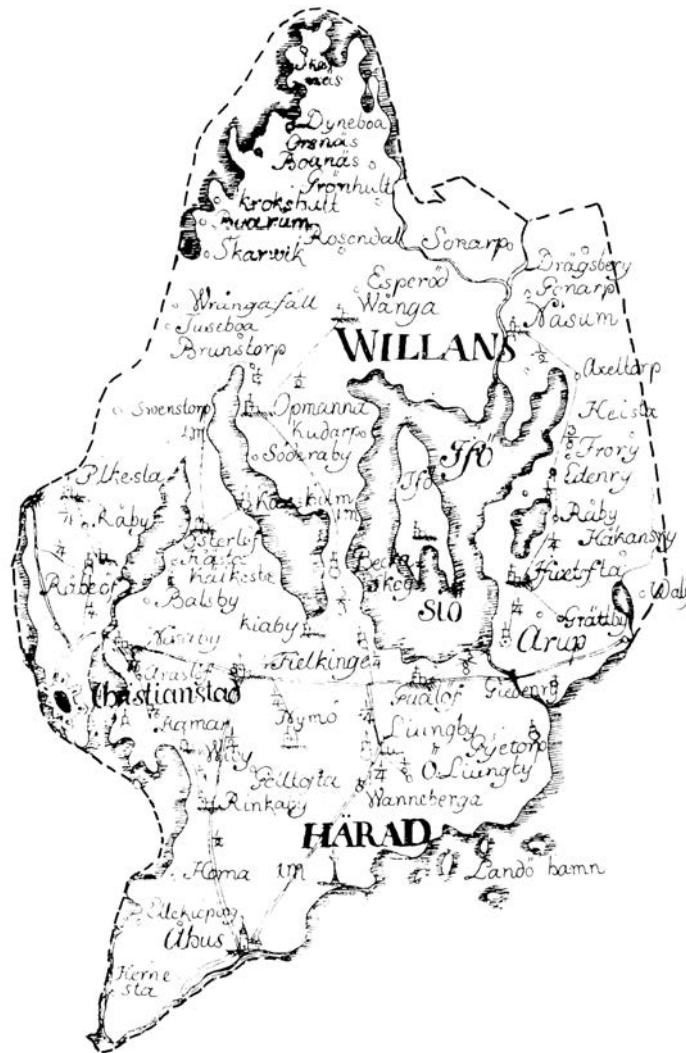
Fig. 1. Willands härad i Kristianstads Län efter Gillbergs 1767 gjorda karta.

kunde mäta sig med dessa. Var kung Atte kom hade han ovänner. De samvetslösa föräldrarna beslöto då att syskonen skulle gifta sig med varandra. Prästerna varnade