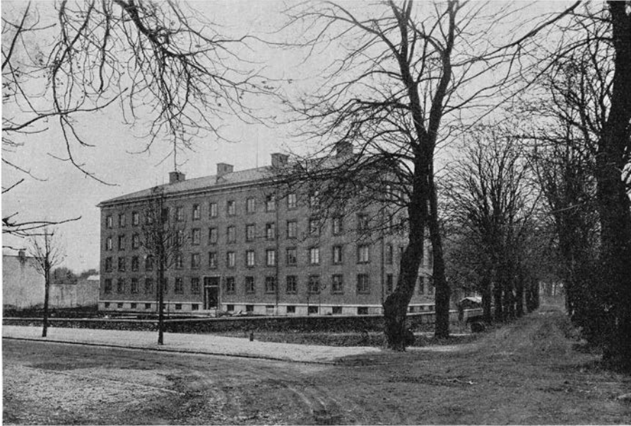
Fig. 1. Nya institutionsbyggnaden för geografi och geologi från nordost. The building of the geographical and geological institutes of the University of Lund from NE. — E. Grothén foto nov. 1931.