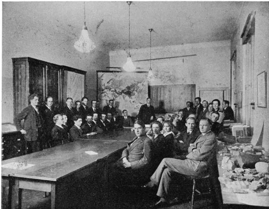
Fig. 2. Föreläsningssalen i institutionens forna lokaler i Gamla bibliotekshuset. Lecture in the old geographical institute Oct. 1930. E. Grothén foto oktober 1931.

under de höga taken i ett omfång, som först framträdde i sin riktiga belysning, då den nya institutionslokalen togs i besittning. Ty det visade sig, att denna var ingalunda tilltagen för stor.