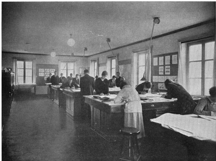
Geografiska institutionen: Stora ritsalen. The geographical institute. Course in map-drawing and cartography. E. Grothén foto nov. 1931.