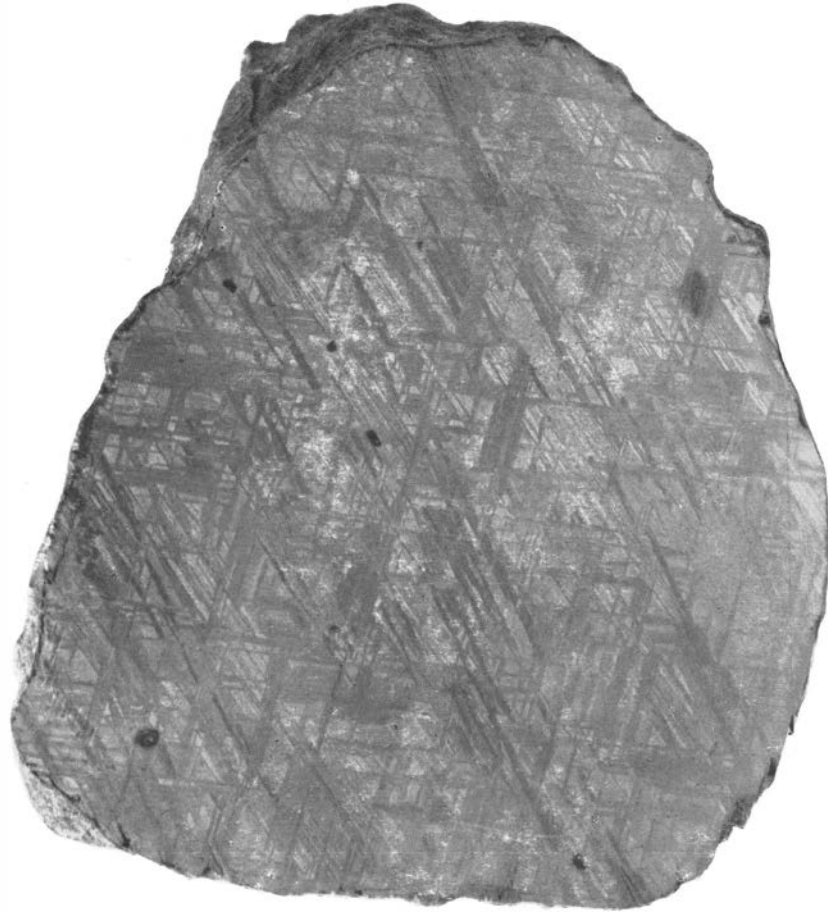
Fig. 3. Geätzte Schnittfläche des Eisenmeteorits. Natürl. Grösse.