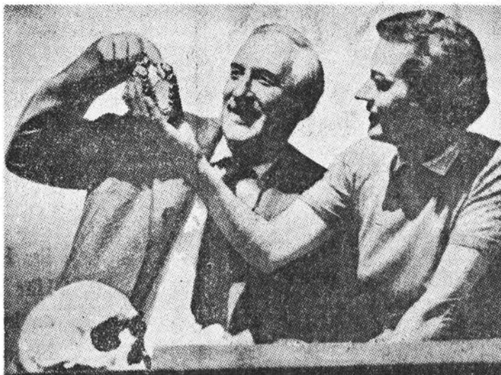
Docent Björn Kurtén berättar här om ett sensationellt fynd av en urmänniska från Olduvai Gorge i Tanganjika. På bilden syns forskarparet Louis och Mary Leakey — som svarar för den märkliga upptäckten — undersöka käkpartiet av Olduvaimänniskan.

Den 17 juli var Leakeys sysselsatta vid en av de blottningar där Olduvaikulturlagren går i dagen. "Ungefär kl 11", skriver Leakey, "såg min fru ett litet fragment av en fossil skalle, en del av tinningbenet, i gruset som hade sköljts ut av erosionen. När hon följde denna ledtråd fann hon tre mänskliga tänder, som stack ut ur bergväggen." Det blev startsignalen för en utgrävning som fortgick till den 6 augusti och resulterade i fyndet av en nästan fullständig skalle tillsammans med mängder av stenredskap av Olduvaityp och ben av gharare, kräldjur, fåglar och ungar av större däggdjur. Benen var utan tvivel rester efter Olduvaivånarnas